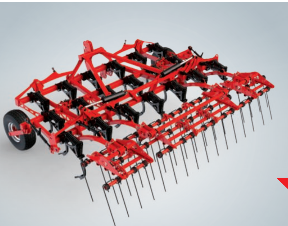
CrossLand ширина захвата 4,4 м, 19 лап, с гребенками и опорными колесами большого размера