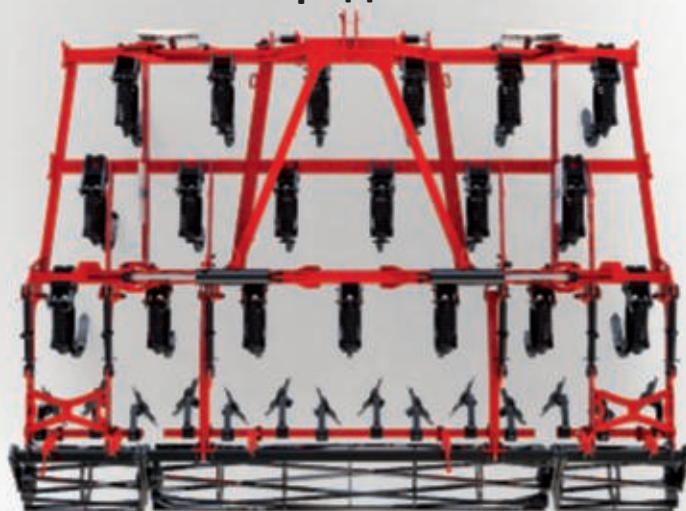
CrossLand ширина захвата 4,4 м, 19 лап, с выравнивающими дисками и прутковым катком